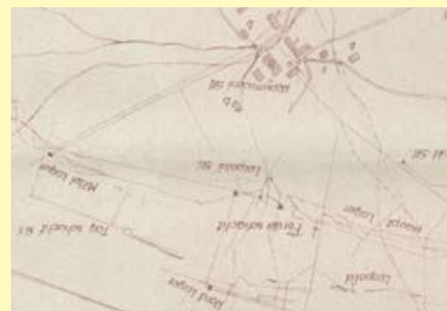
Ein Kartenausschnitt der Bergwerke in Savske jame circa um das Jahr 1880

Viktor, Heinrich und Tona sind in der Tat historische Personen , die entweder auf einer oder anderer Art und Weise mit der Bergbauvergangenheit in Savske jame verbunden waren. In deren lebendiger Inszenierung wird ein Teil der Alten Erz Route wiederbelebt, die als Themenroute und Spurenweg angelegt ist, auf dem einstmals die Fuhrlaute das Erz aus den Bergwerken in Savske jame bis zu den Hochofen in Sava transportiert haben. Während eines Spaziergangs können die Besucher auf dem Weg die Geschichte des Bergbaus und die damit verbundenen Tätigkeiten kennenlernen. Entlang des Weges sind Informationsstafeln und Ausstellungsexponate aufgestellt. Die Alte Erz Route besichtigen Sie allein, mit einem Reiseleiter, ist aber auch für den Besuch einer größeren organisierten Gruppen geeignet. Im Verlauf des Besuchs in Savske jame können Sie auch, im Falle einer rechtzeitigen Benachrichtigung, auf der Route von Viktor Heinrich und Tona erwartet werden.