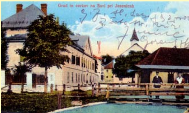
Das Haus der Ruards – das Schloss (links) in Stara Sava bei Jesenice um 1900